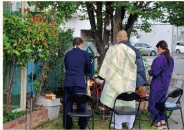
TSUBASA慰霊碑前で慰霊祭をスタートです。お天気にも恵まれ暑いぐらいの中、お弟子さんもお一緒に、お三方で供養をしていただきました。