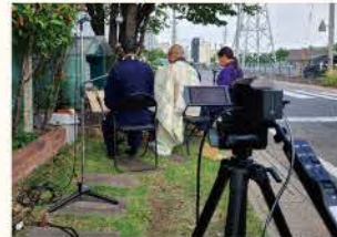
カメラの配置、マイクの配置なども考えながらセッティング。カメラの裏では、その日出勤のTSUBASAスタッフも参列していました。