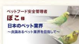
ペットフード安全管理者 ほこ 様 日本のペット業界 ～良識あるペット業界を目指して～