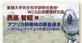
星槎大学共生科学部特任教授・WCS自然環境研究員 西原 智昭 様 アフリカ熱帯林の野鳥保全 ～ヨウムとサイチョウの最近の動向～