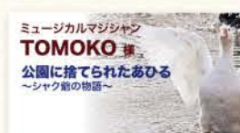
ミュージカルマジシャン TOMOKO 様 公園に捨てられたあひる ～シャク籠の物語～