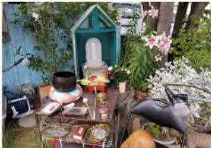
慰霊祭の日の慰霊碑には、普段より豪華に果物やお花をお供えます。