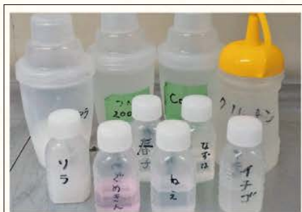
治療中の鳥たちの薬水

動脈硬化症 は、動脈が硬化し血液の流れが滞ることで組織に障害をもたらします。動脈硬化症を引き起こす原因は様々で