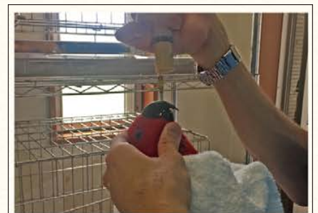
強制給餌 治療中の母(オオハナインコ)

今後もTSUBASAの鳥たちの健康管理や治療に努め、また新たな見解を発信できればと思います。