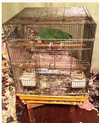
引き取り時の様子 状態は薄暗い部屋の中で、餌は ヒマワリのみ。しかし羽の状態 も良く比較的元気な様子でした。