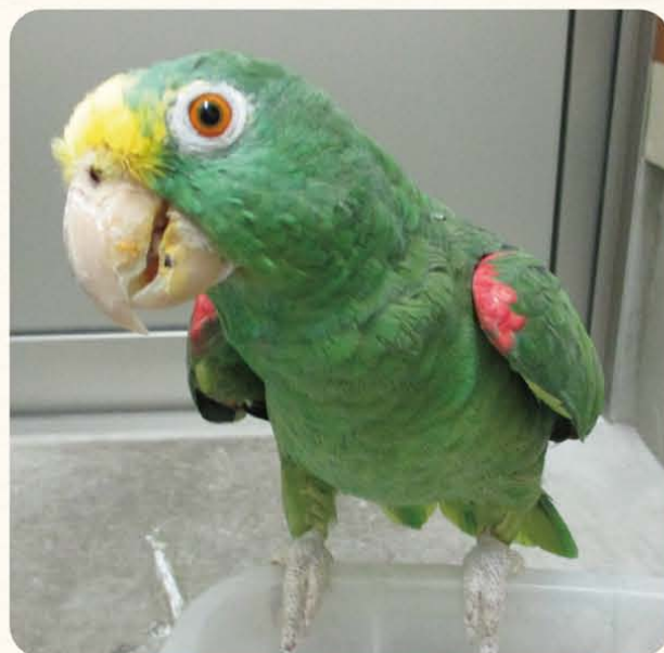
※保護したキビタイボウシインコは現在検疫中のため見ることはできません。