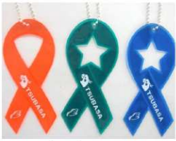
コースリボン 反射板