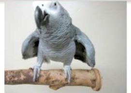
天然木手作り止まり木 (サイズいろいろ)

CAP! 楽天店の姉妹店、「とり村通販サイト」が2011年12月にオープンしました。